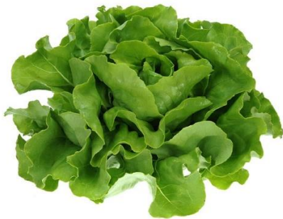
De onbespoten krop sla die mevrouw De Vries in haar moderne shopper stopte.

‘Ach ja, de meeste van hen zijn wel aardig. Ons dorp fleurt ervan op.’