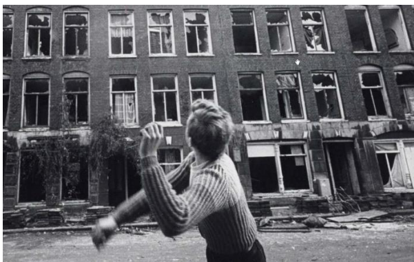
AMSTERDAM: In de jaren '70 ontvluchtten Nederlanders de grote steden, op zoek naar een woning met een tuin. Binnensteden verpauperden.

Ik begin het te begrijpen. ‘Dus sommige gebieden trekken bedrijvigheid aan. Ze hebben veel, dus krijgen steeds meer?’ ‘Bingo. We noemen die gebieden attractoren. Er zijn dus ook gebieden die steeds meer kwijtraken. In de niet-lineaire wetenschap zijn dat zogenaamde repulsoren.’ ‘Je hebt dus positieve en negatieve velden, zoals bij een magneet?’ ‘Yeps. Voorheen was de Randstad een echte attractor. Het noorden – althans waar het ’t platteland betrof – had alle kenmerken van een repulsor. Huizen kwamen leeg te staan, winkels verdwenen, bibliotheken werden gesloten – het stomste wat je kunt doen! – en scholen werden samengevoegd.’